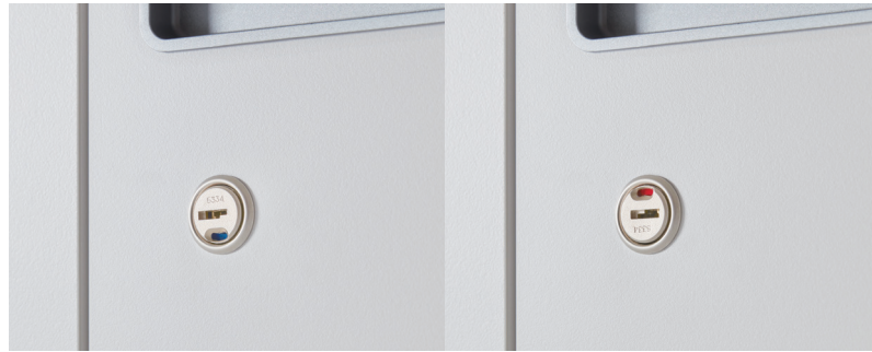
잠금 ON / OFF 확인

잠금장치의 전면에 작동에 따른 on / off가 깔끔하게 표시되어 편리하게 확인할 수 있습니다.