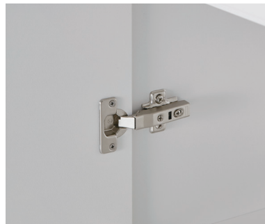
도어 힌지 (댐핑형)

부드러운 사용감으로 도어를 열고 닫을 때 소음 없이 조용하게 사용할 수 있습니다.