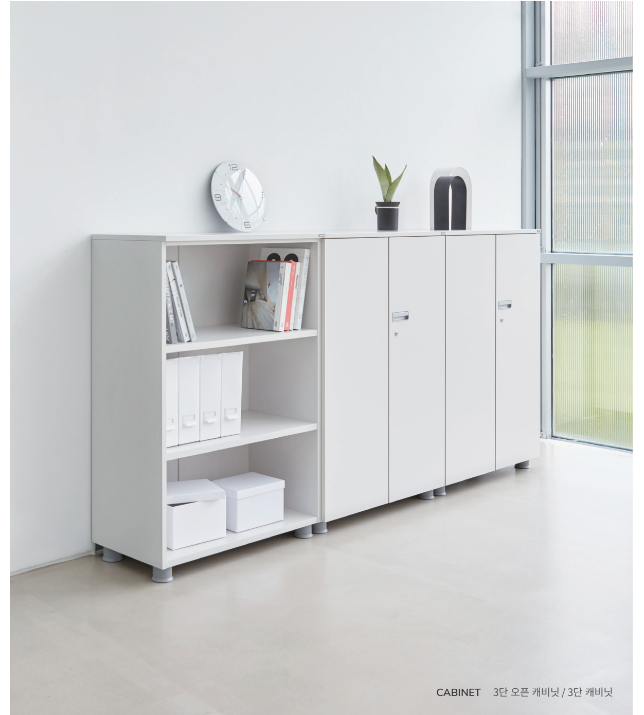
CABINET 3단 오픈 캐비닛 / 3단 캐비닛

깔끔한 외관이 돋보이는 손잡이는 열림과 닫힘 상황에만 돌출되는 방식으로 편리한 사용감을 전달합니다.